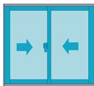
Antepecho de dos hojas móviles